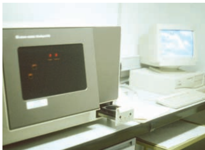
Foto 2. NIRS para la determinación del contenido de proteína y fibra bruta.

(41° 39' N, 0° 51' E) a 254 m de altitud sobre suelos de tipo Calcixerollic xerochrepts. El clima corresponde, según la clasificación de Papadakis, a un invierno “cebada fresco” y verano “algodón menos cálido”, que permite el cultivo de alfalfa bajo regadío.